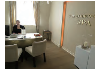
スパ施設「Vier Jahreszeiten Spa &amp; Fitness」は 100 種類以上のトリートメントを用意する