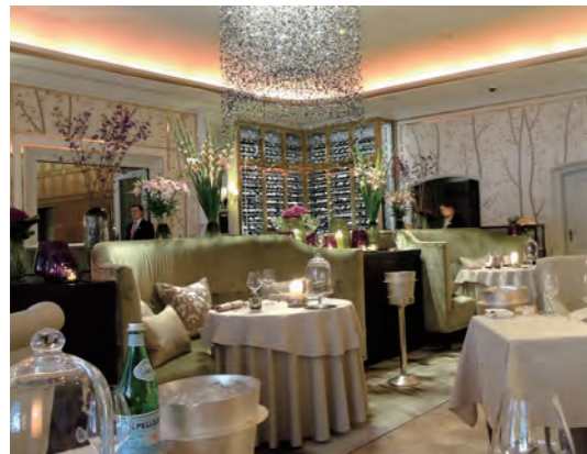
創業者である Haerlin の名を冠した「Restaurant Haerlin」では、ミシュラン 2 つ星を獲得した正統派のフランス料理が楽しめる