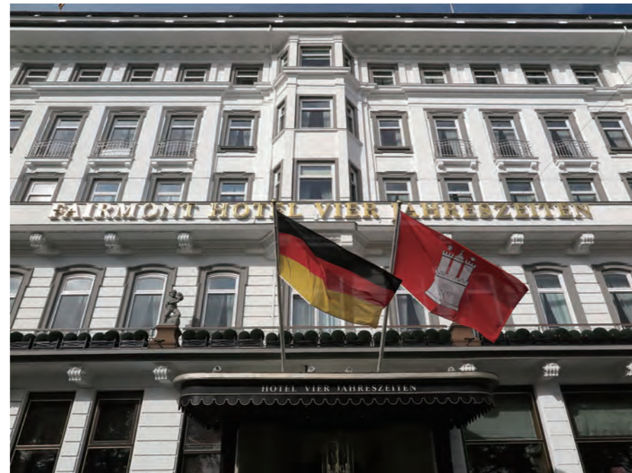
ドイツ語で“四つの季節”、つまり英語で“Four Seasons”という意味を持つ「Hotel Vier Jahreszeiten」イサドア・シャープが創業したフォーシーズンズホテル誕生のエピソードを持つドイツ屈指の名門ホテルだ