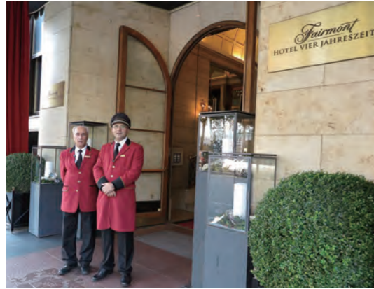
Fairmont Hotel Vier Jahreszeiten の銘板を掲げたホテル正面エントランス