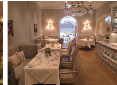
清潔感あふれ、明るい雰囲気朝食を提供する「Café Condi」