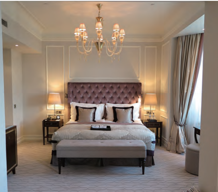
約 55㎡の広さを持つ「Junior Suites Lakeview」のベッドルーム。文字通り美しいアルスター湖を望むエレガントな Jr. 스위트だ