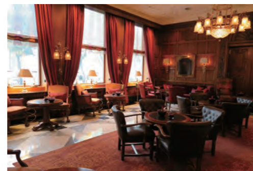
ホテル中心に位置するラウンジ「Wohnhalle」は、英国の邸宅を思わせる重厚な時が流れる