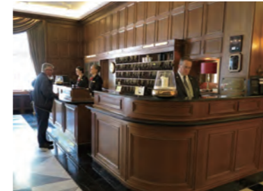
昔ながらのレターホルダーとルームキーが並ぶ重厚なレセプションとコンシェルジュデスク