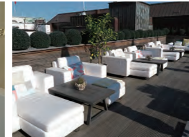
ハンブルクの街並みが一望できる「Rooftop Terrace」。スパ内から直接アクセスできる