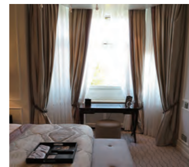
ベッドルームにある出窓部分。ドレープカーテンとタッセルの組み合わせが秀逸