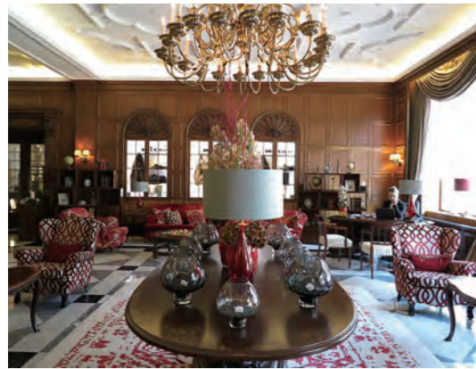
ドイツらしい端正なエントランスロビー。窓からはアルスター湖が望める