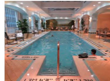
新たに改装したスイミングプール