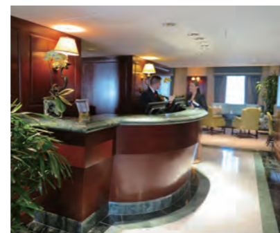
12階にあるゴールド専用ラウンジ「Fairmont Gold Lounge」のレセプション