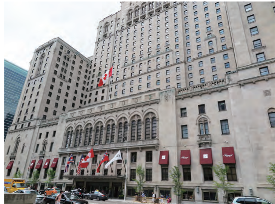
「Fairmont Royal York」は、28階建て高さ124mの外観はヨーロッパのシャトーを彷彿とさせる壮麗な造りで、かなり離れた場所からようやくホテル全景が見渡せる