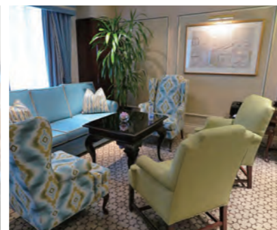
「Fairmont Gold Lounge」内のゆったりとしたラウンジ