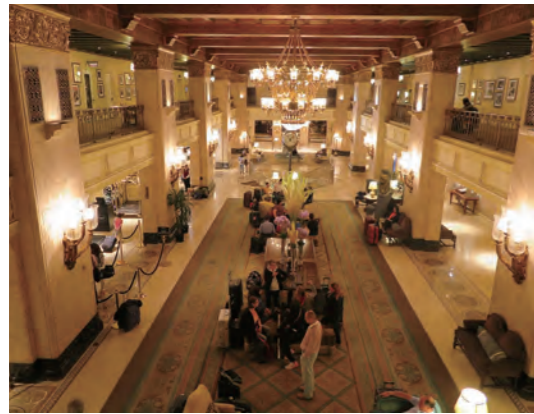
クラシカルなグランドロビーは重厚な空気が流れ、まるで当時の城内にタイプスリップしたような雰囲気だ