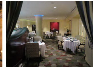
エレガントなメインダイニング「EPIC」。地元オンタリオ産の食材を使った料理が人気だ