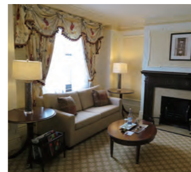
ファイアプレイスが置かれたクラシカルなリビング