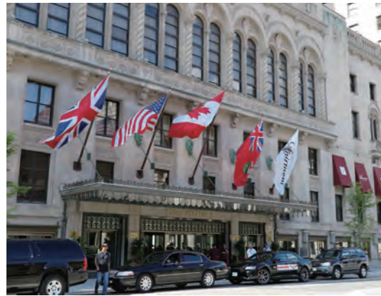
「Fairmont Royal York」の正面エントランス。創業当時イギリス連邦で最大級のホテルとして君臨していた