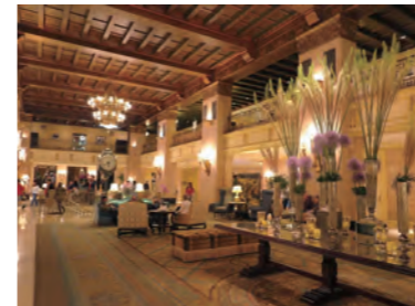
シャンデリアが輝く重厚なロビー。随所に趣のあるクラシカルな調度品などが置かれている