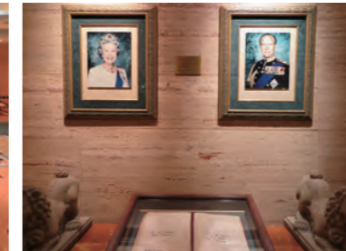
グランドロビーにはエリザベス2世女王夫妻の写真と直筆のサインが展示されている