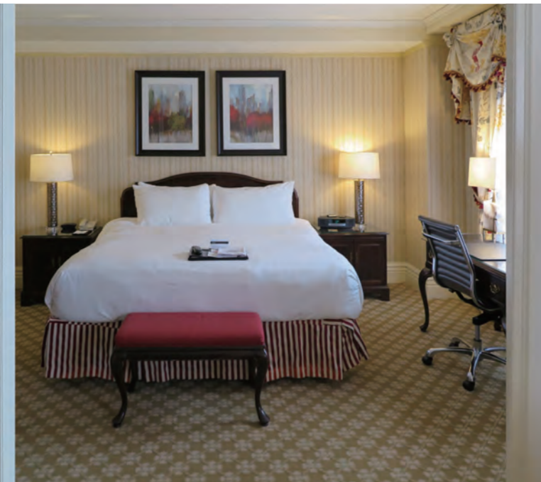
「Fairmont Gold Junior Suites」のベッドルーム。ユニオン駅を見下ろす約42㎡のJr.スイートで、12階にある専用ラウンジ「Fairmont Gold Lounge」にアクセスでき利便性は高い