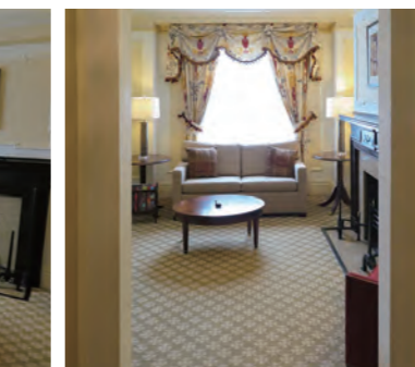
リビングルームを玄関ホワイエから望む

「Fairmont Royal York」、まるで周囲を睥睨する へいび ような巨大なホテルである。28階建て高さ124mの外観はヨーロッパのシャトーを彷彿とさせる壮麗な造りで、かなり離れた場所からようやくホテル全景が見渡せる。創業時から客室数は1000室以上と、実にイギリス連邦で最大級のホテルとして君臨していた。創業は1929年、開通したばかりのカナダ太平洋鉄道(CPR)の駅と直結する大型ホテルとして盛大にオープンした。トロントを代表する歴史的ホテルであり、この街のランドマークとして市民に親しまれている。ホテルの目の前には豪華なユニオン駅があり、ここは人々が行き交うターミナルのような存在でもある。