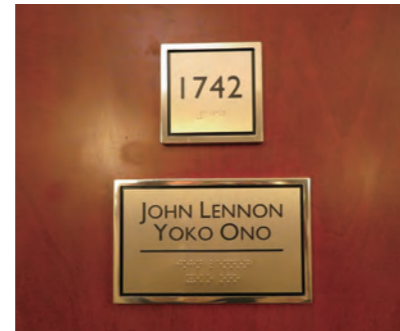
スイート1742号室ドアには「John Lennon &amp; Yoko Ono」の銘板が掲げられている