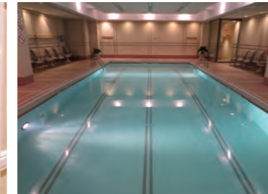
「Health Club」にあるスイミングプール