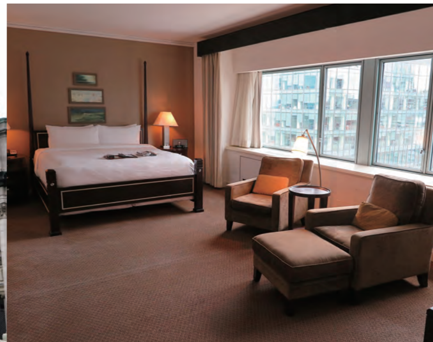
「Large Fairmont Gold Room」のモダンなベッドルーム。約42㎡の面積があり、間口を広く取った窓からモントリオールの美しい風景が望める