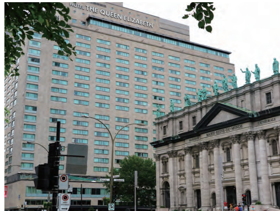
ホテルに隣接して大聖堂「Mary Queen of the World Cathedral」から望む「Fairmont The Queen Elizabeth」の正面ファサード。ダウンタウンの中心に立つモントリオール最大規模の名門ホテルだ