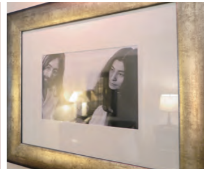
スイート室内には当時のジョン・レノンとヨーコ・オノの写真が多く飾られている