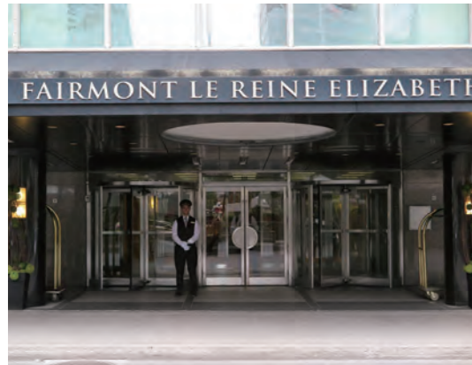
フランス語で「Fairmont Le Reine Elizabeth」と表示された、ホテル正面エントランス