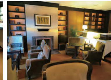
クラブラウンジ内は落ち着いた気品あるレイアウトだ