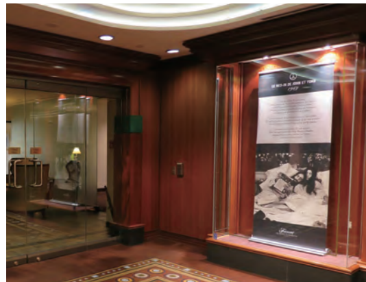
「Le Bed-In de John et Yoko, 1969」と銘打って、詳しい解説と写真をホテル館内に掲げている