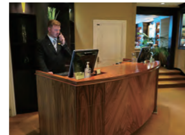
19階にあるゴールドゲスト専用の「Fairmont Gold Lounge」のレセプションデスク