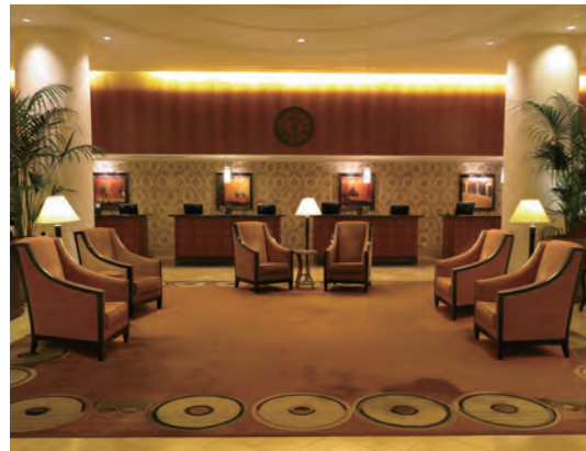
982室の客室を持つモントリオール屈指のホテルゆえ、機能的なレセプションデスクが並ぶロビーフロア