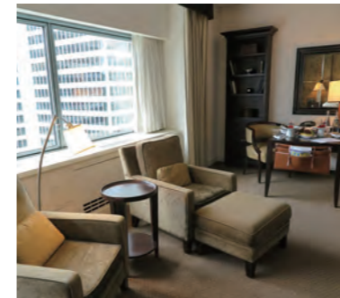
余裕のあるシッティングエリア