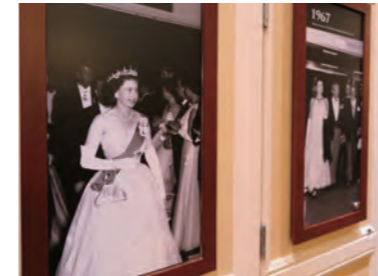
ホテル館内にはエリザベス女王をはじめ、訪問した英国王室や各界の著名人の写真が飾られている