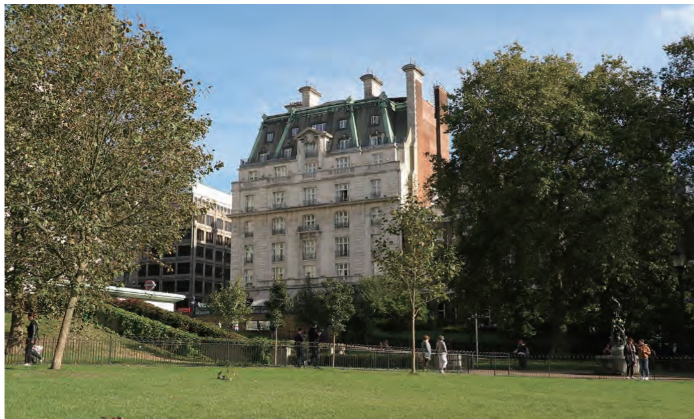
ロンドンで別格の伝統と格式を誇る名門ホテルがリッツロンドン「The Ritz London」である。“ホテル王”と呼ばれたセザールリッツの指揮の下、「Ritz Paris」と同じくシャルル・ミュースとアーサー・デイヴィスの建築により、ロンドン市内中心部、ピカデリー通り沿いのグリーンパーク脇に建てられ、1906年5月25日に開業した