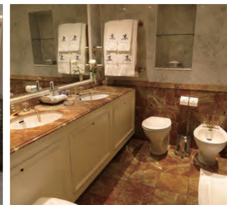
ゴージャスな大理石とゴールドの水栓金具が美しいバスルーム

同じく、シャルル・ミュースとアーサー・デイヴィスの建築により、ロンドン市内中心部、ピカデリー通り沿いのグリーンパーク脇に建てられ、1906年5月25日に開業した。2002年11月、チャールズ皇太子の誕生パーティーがホテル内で開催され、エリザベス2世女王とエディンバラ公が臨席した。同年にはチャールズ皇太子よりロイヤル・ワラント（御用達指名）を受けている。