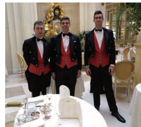
スタッフの多くは燕尾服でゲストに対応している