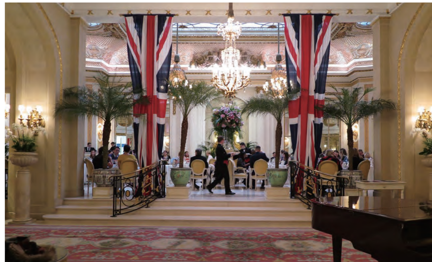
人気のラウンジ「The Palm Court」はアフタヌーンティーの予約客でいつも賑わっている