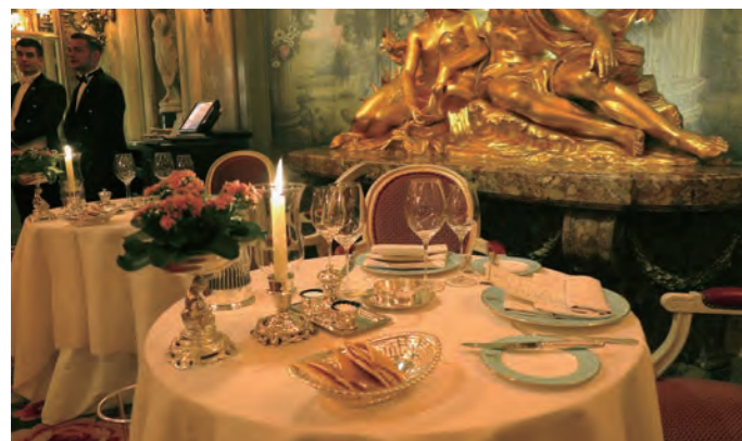
絢爛豪華な雰囲気に満ちた「The Ritz Restaurant」の店内