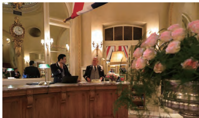
威厳が感じられるコンシェルジュデスク