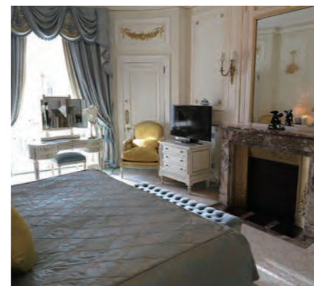
リノベーションが済んだばかりで、グリーンパークに面した気品あふれるスイートだ