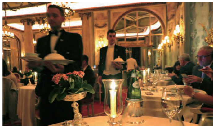
スタッフの多くが燕尾服で対応し、きびきびとした所作が気持ち良い