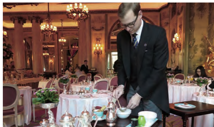
本式の作法を求めるのは無理があるが、茶室で使う正式の茶釜を用意し、ゲストの前で見事な点茶を披露している