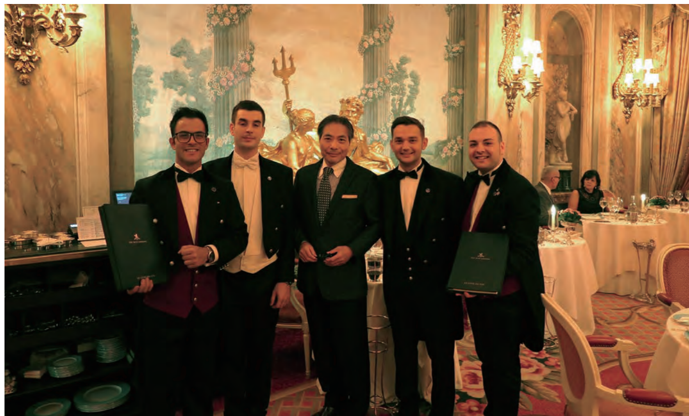
メインダイニング「The Ritz Restaurant」は、開業後しばらくの間は伝説のエスコフィエが指揮を執っていたレストランで、2017 ミシュラン英国版で念願の1ツ星を獲得している