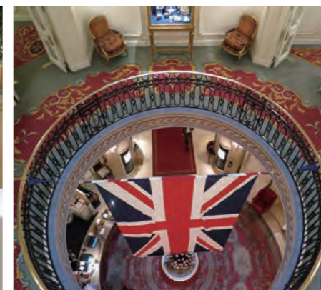
エントランスホールは上層に筒状に抜けており、ラウンジ状に空間が広がる