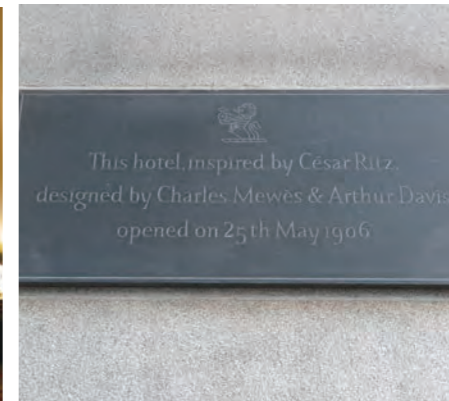
ホテル側面の外壁に、“ホテル王”と呼ばれたセザールリッツの歴史的プレートが掲げられている

世界にはまだまだ日本人が訪れていないホテルがある。このコーナーではホテルエグゼクティブが知っておくべき「世界のリーディングホテル」を紹介する。これまで多くのホテル紹介本が出版されてきたが、そのほとんどが現地のホテルと事前に取材の連絡を取り合い、プロのカメラマンや通訳、そのほか大勢を連れ立ての大名取材であり、宿泊は省略といったことも多々であった。本連載では、著者自身が長年にわたる個人旅行中に自分の目で感じ取り、コメントを書き込み、自分のカメラで思いのままを撮ってきた写真を掲載する。