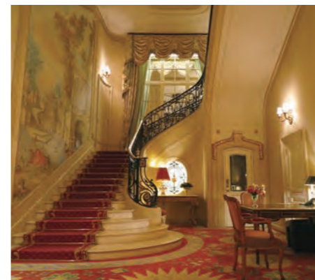
エントランスホールの脇に設えた壮麗なステアケース