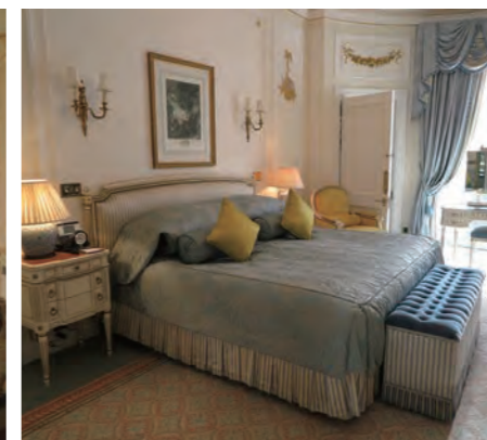
気品ある「Deluxe Suite」のベッドルーム