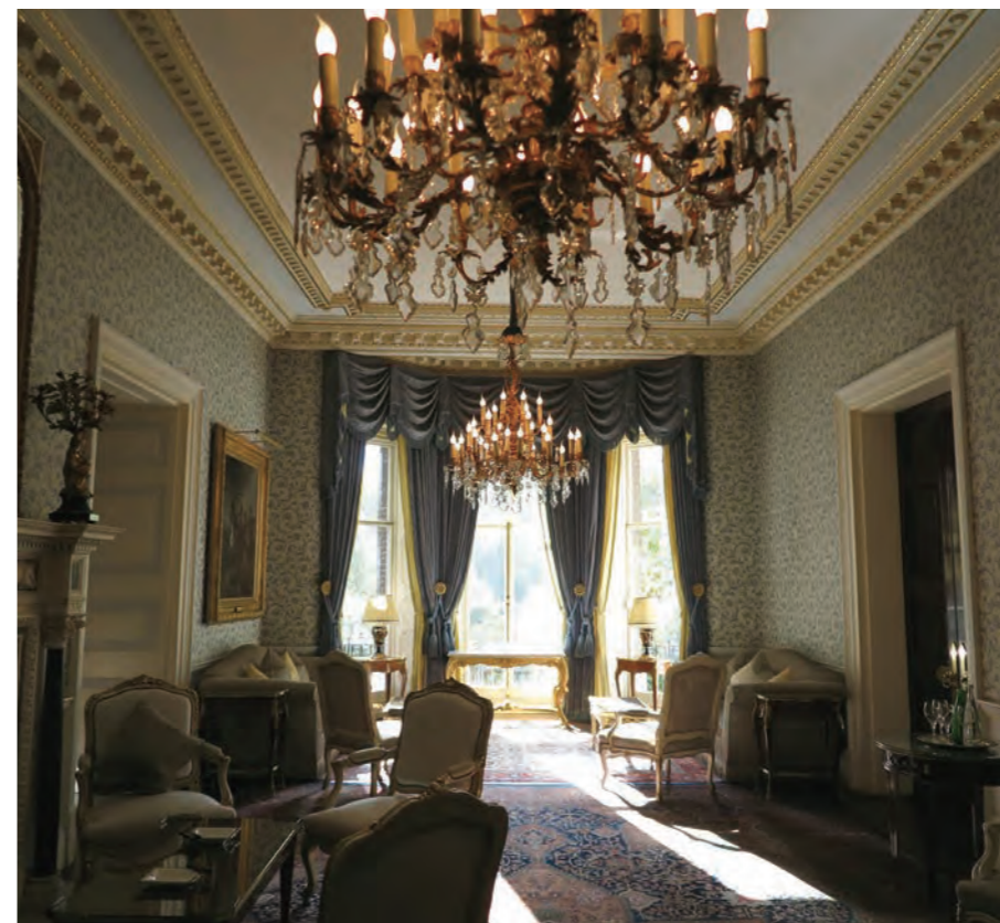
館内には多くのボールルームを用意し、そのうちの1つ「The Queen Elizabeth Room」は息を呑む贅沢な空間である