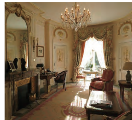
「Deluxe Suite」内装は、所々に金箔があしらわれたルイ16世調のインテリアデザインを持つ