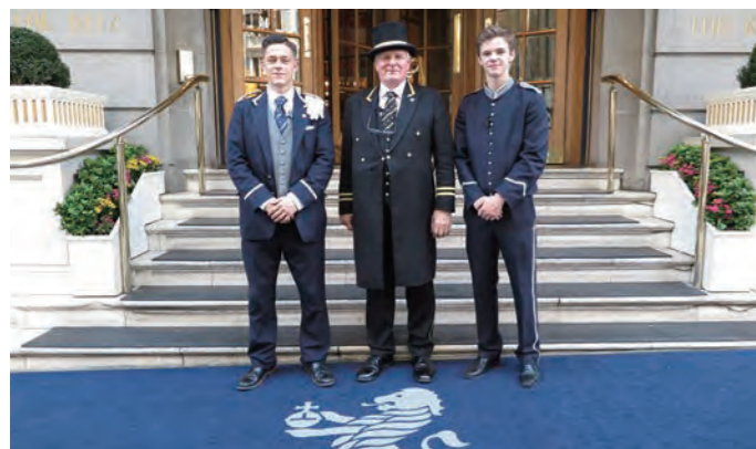
凛々しい姿のドアマンとベルキャプテン