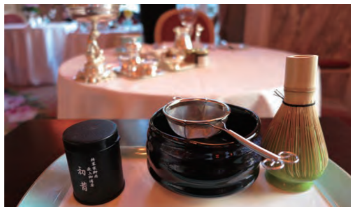
“将軍家御用最上御濃茶”「初音」の抹茶サービス