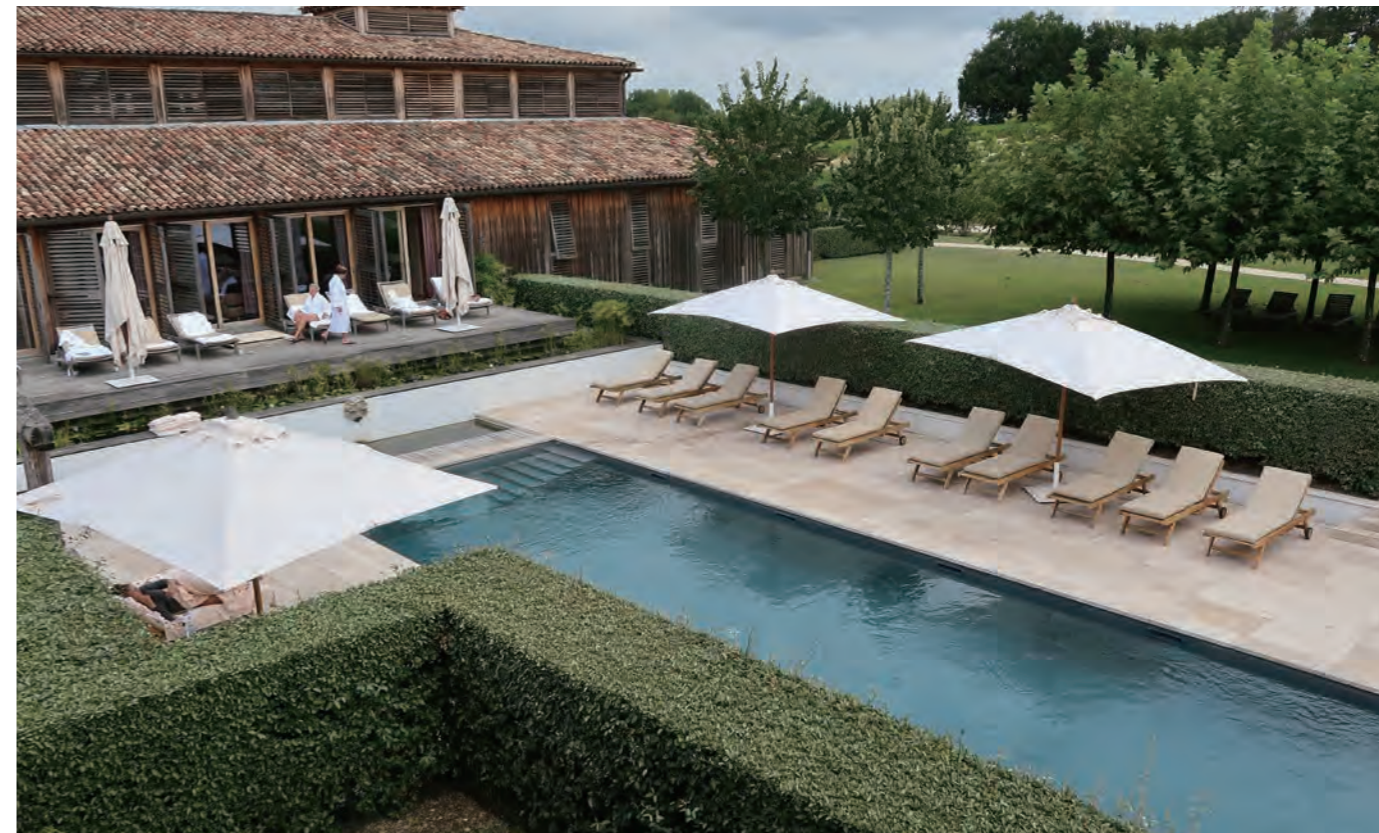
「Caudalie, the Vinotherapie Spa」の全景。ブドウに含まれるポリフェノールがもたらすアンチエイジングや抗酸化作用などの特性を活用して誕生したスキんケアブランドとしても有名だ。コーダリー社が独自に開発したワイン+セラピーを組み合わせた「ヴィノセラピー」は商標登録されている