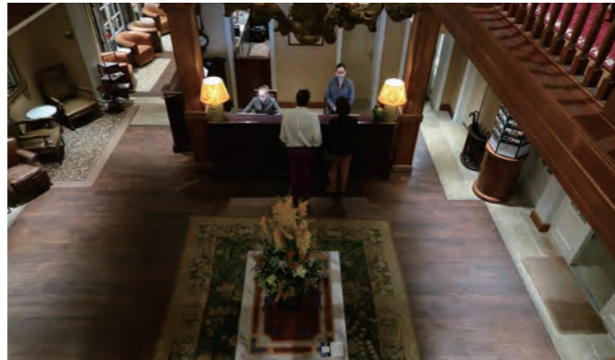
中2階回廊から俯瞰したレセプションデスク。コーダリーはスモールホテル・オブ・ザ・ワールド「SLH」傘下にある旗艦ホテルだ

現在、筆者のホームページで 「世界のリーディングホテル」を連載中。 多くの美しい写真と興味深いコメントで、 世界中のホテルとそれら関連都市を紹介。