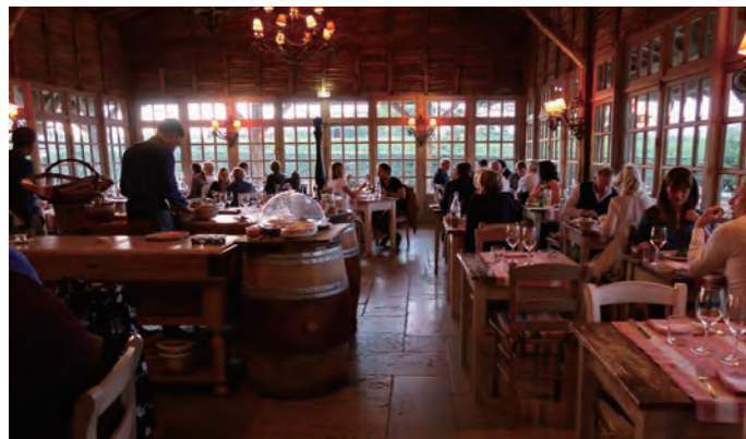
カジュアルレストラン「La Table du Lavoir」は田舎造りの雰囲気、地元料理とワインを楽しめる