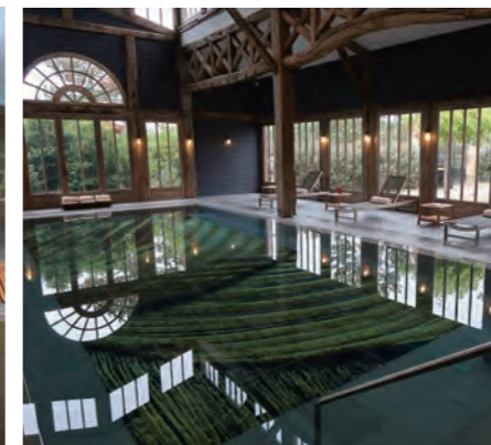
スパ施設内にある野外プールとは別に、一戸建てで用意された室内のスイミングプール

リフェノールがもたらすアンチエイジングや抗酸化作用などの特性を活用して誕生したスキンケアブランドとしても有名だ。コーダリー社が独自に開発した「ワインセラピー」を組み合わせた“ヴィノセラピー”は商標登録され、「Caudalie, the Vinotherapie Spa」で体験できる。