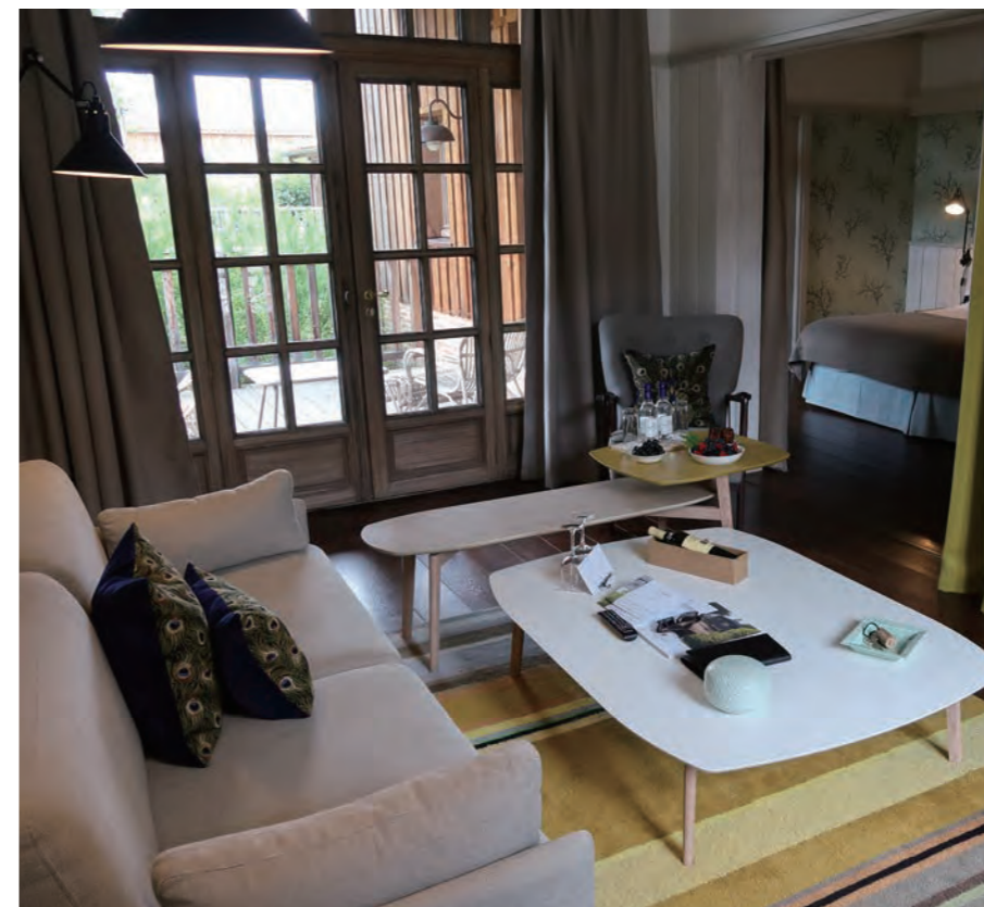
“フィッシャーマンズヴィレッジ”「Le Village des Pêcheurs」と呼ばれる大型のコテージ「Large Suite」のリビングルーム