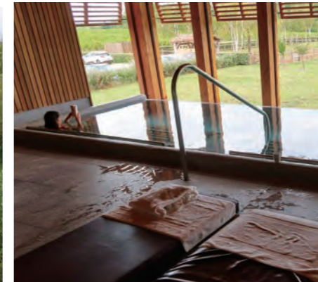
読書もできる眺めの良いジャグジーバス

世界にはまだまだ日本人が訪れていないホテルがある。このコーナーではホテルエが知っておくべき「世界のリーディングホテル」を紹介する。これまで多くのホテル紹介本が出版されてきたが、そのほとんどが現地のホテルと事前に取材の連絡を取り合い、プロのカメラマンや通訳、そのほか大勢を連れ立っての大名取材であり、宿泊は省略といったことも多々であった。本連載では、著者自身が長年にわたる個人旅行中に自分の目で感じ取り、コメントを書き込み、自分のカメラで思いのままを撮ってきた写真を掲載する。