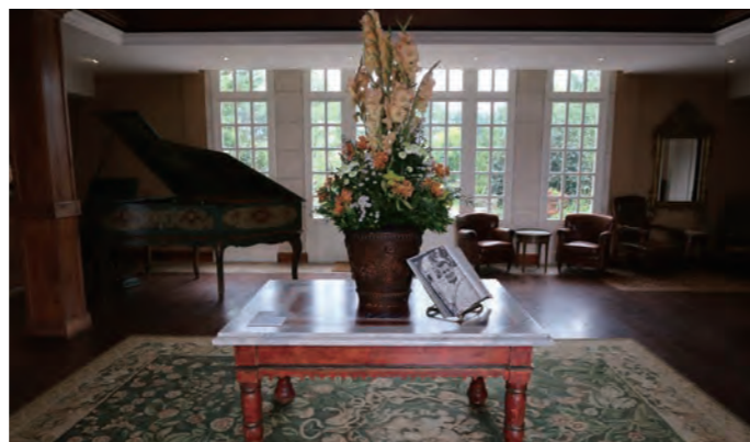
コーダリーのエントランスホール。フランスホテル最高峰の格付け「PALACE」の認定を2016年に授与され、改めてその実力を世界に知らしめた