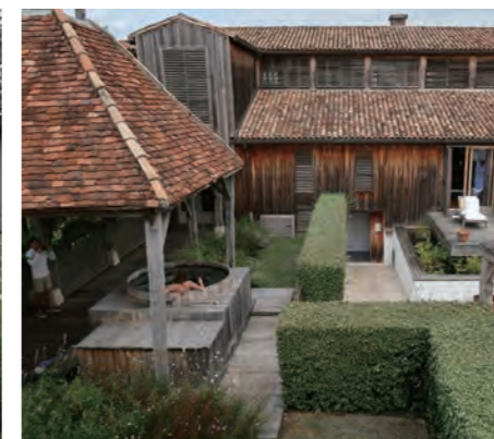
地下540メートルから汲み上げた地下水とブドウを使った「ヴィノセラピー」が有名で、左手に樽風呂も見える