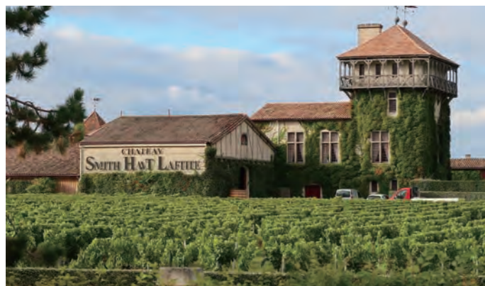
コーダリーからペサック・レオニヤンの格付け、「Château Smith Haut Lafitte」のシャトーが目の前に望める