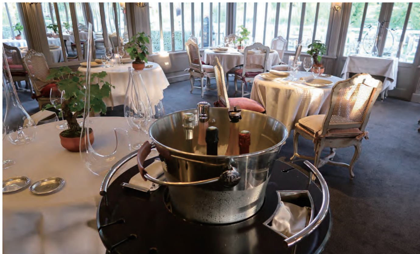
メインダイニング「La Grand Vigne」は、エグゼクティブシェフのNicolas Masse氏が腕を振るい、ミシュラン2ツ星を獲得している