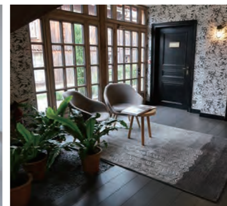
「Le Village des Pêcheurs」と呼ばれる大型のコテージの「Large Suite」を紹介したい。65㎡の広さを持ち、2方向のテラスが付帯した木の香りが漂う心地よいスイートだ。ホテル内には2軒のレストランがあり、メインダイニング「La Grand Vigne」はエグゼクティブシェフのNicolas Masse氏が腕を振るい、ミシュラン2ツ星を獲得している。カジュアルレストラン「La Table du Lavoir」は田舎風の戸建てで、地元料理とワインを堪能できる。コーダリーは食事、ワイン、スパと三拍子揃ったリユクスな滞在を堪能できる、大人の隠れ家ホテルと言えよう。