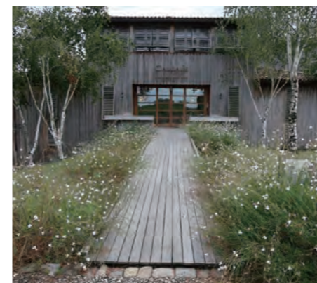
スパ施設「Caudalie, the Vinotherapie Spa」の自然木を利用した正面エントランス