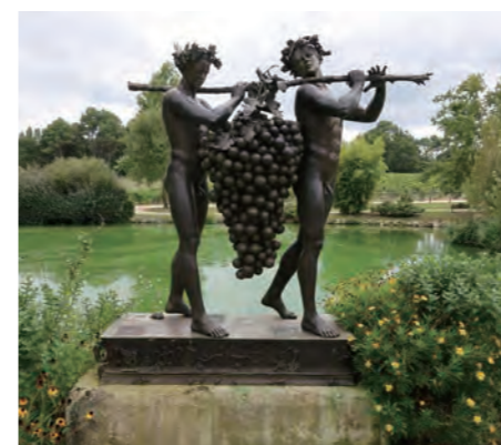
聖書の一節、「カナン偵察」に由来する、大きなブドウの房を担いだ少年の像