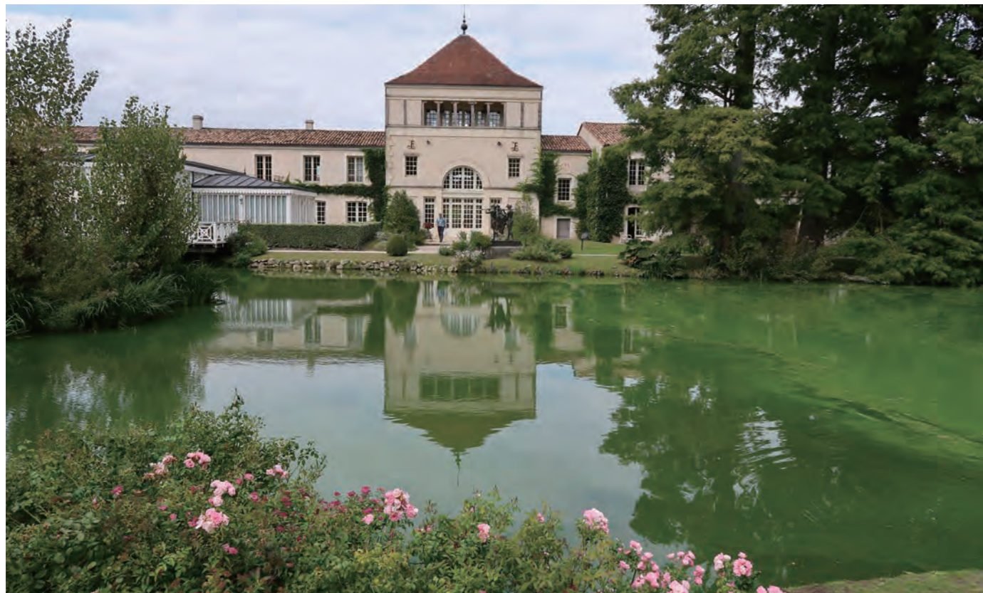
レ・スルス・ド・コーダリー「Les Sources de Caudalie」は、ボルドー郊外グラヴ・マルティヤック地区にあるワイナリー「Château Smith Haut Lafitte」の敷地内にある。ブドウの恵みを最大限に活用したスパ施設を持つラグジュアリーホテルだ