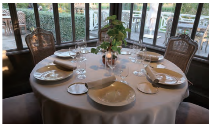
美しいテーブルセッティング。メドック、グラヴ地区で屈指のミシュラン2ツ星レストランだ