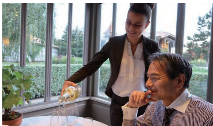
メインダイニング「La Grand Vigne」はスパとワイン、そしてキュービナー・クラシックの正餐を堪能できる