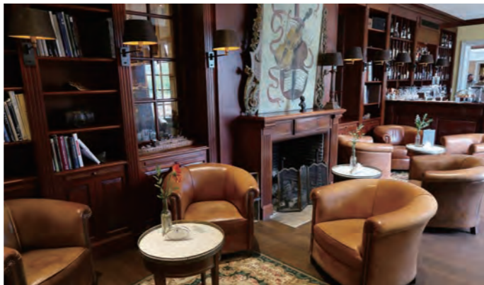
メインダイニングに隣接して用意されたライブラリー感覚のシガーバー