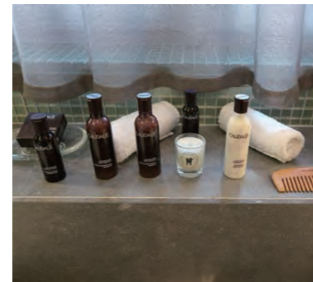
コーダリー社製のバスアメニティーキット