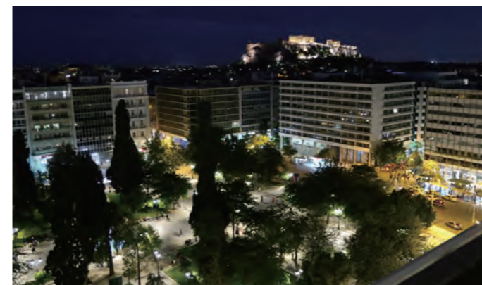
専用テラスから望むライトアップされたアクロポリスの丘