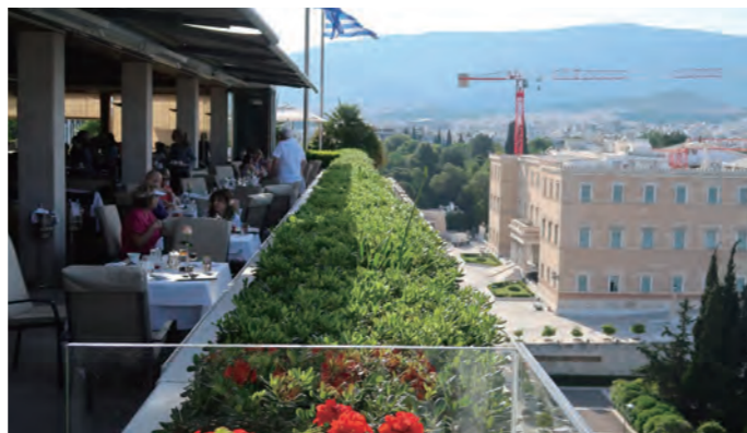
右手に国会議事堂とアテネの心臓部「シンタグマ広場」を望む