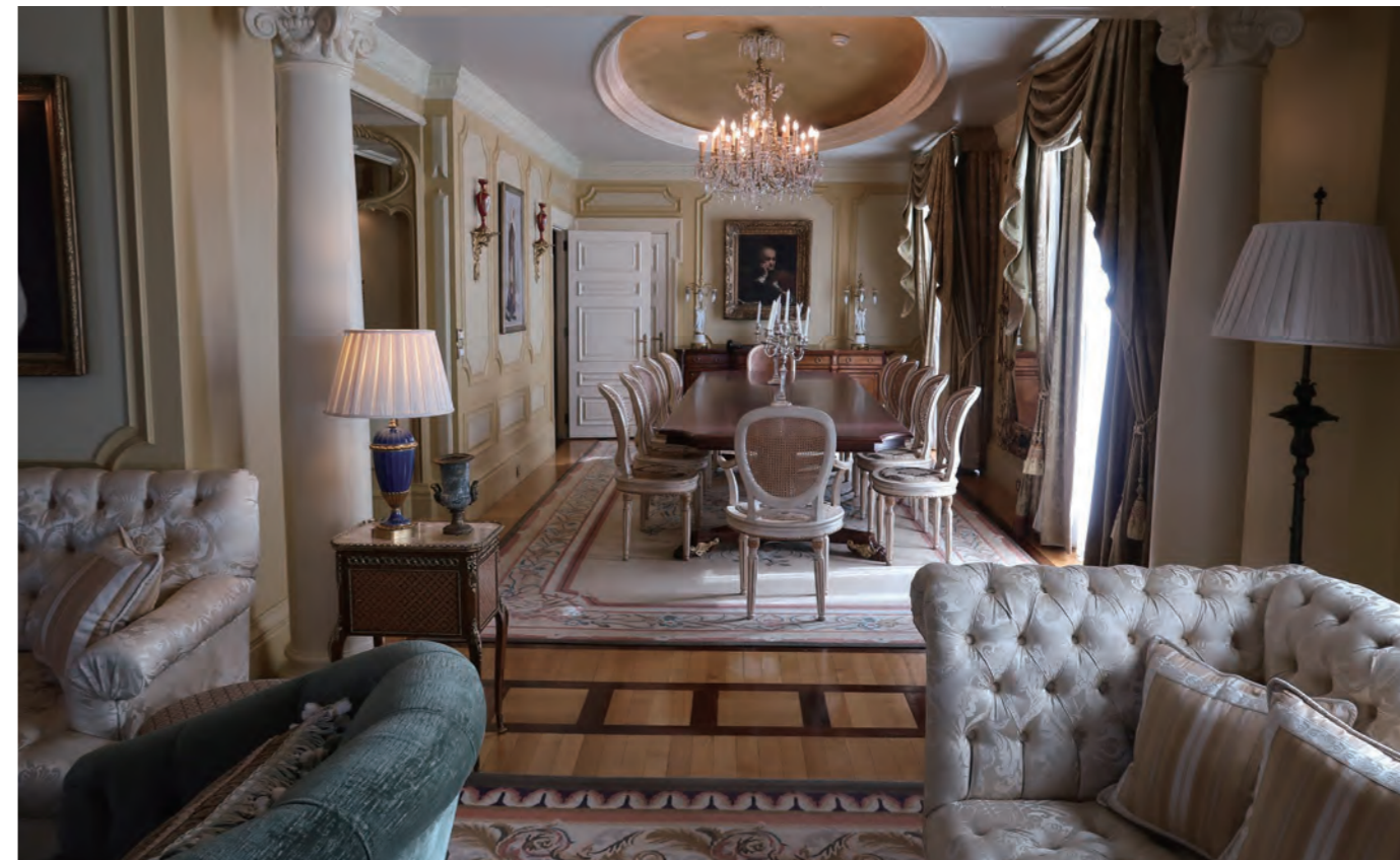
ホテルを代表するスイート「Presidential Suite」の気品あるダイニングルーム。約 200㎡の広さを持ち、リビング、ダイニング、ベッドルームなど贅をつくした造りである

パルテノン神殿は古代ギリシャの最も重要な遺跡であり、1987年に世界遺産にも登録されている。パルテノンの名前は、「処女宮」という意味の「パルテノス Parthénos」に由来し、処女神アテナに捧げた宮殿である。グランド ブルターニュは、そんなパルテノン神殿を身近に感じられる貴重なホテルと言えよう。