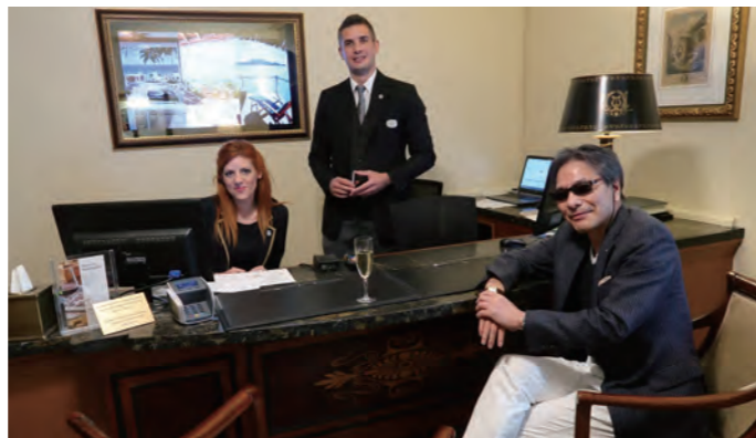
グランド ブルターニュはパトラー制度が充実しており、パトラーフロアのゲストは専用ルームでゆったりとチェックインできる