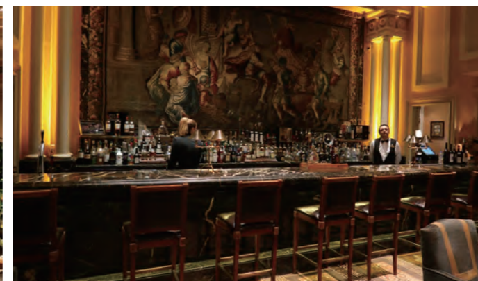
メンバー「Alexander's Bar」のカウンター背後に掛けられた大型のタペストリーが圧倒的な存在感を誇る