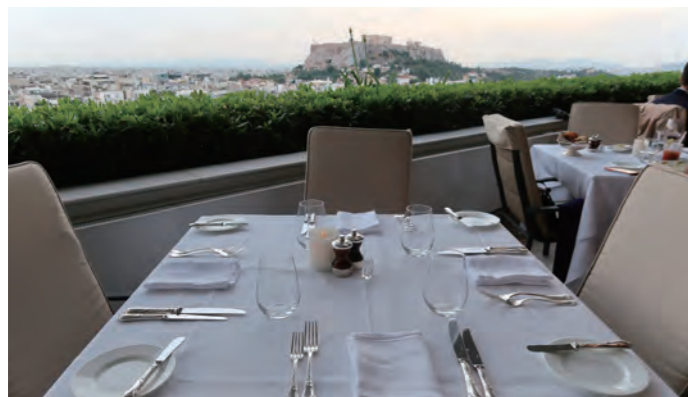
メインダイニング「GB Roof Garden Restaurant」のテラス席から望むアクロポリスの丘