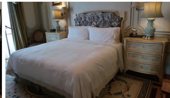
スイート「Presidential Suite」の奥に設置されたベッドルーム