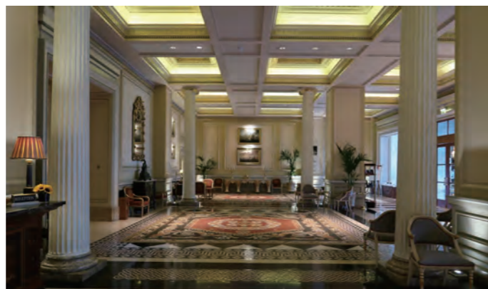
シンメトリックの端正な空気感のエントランスホール