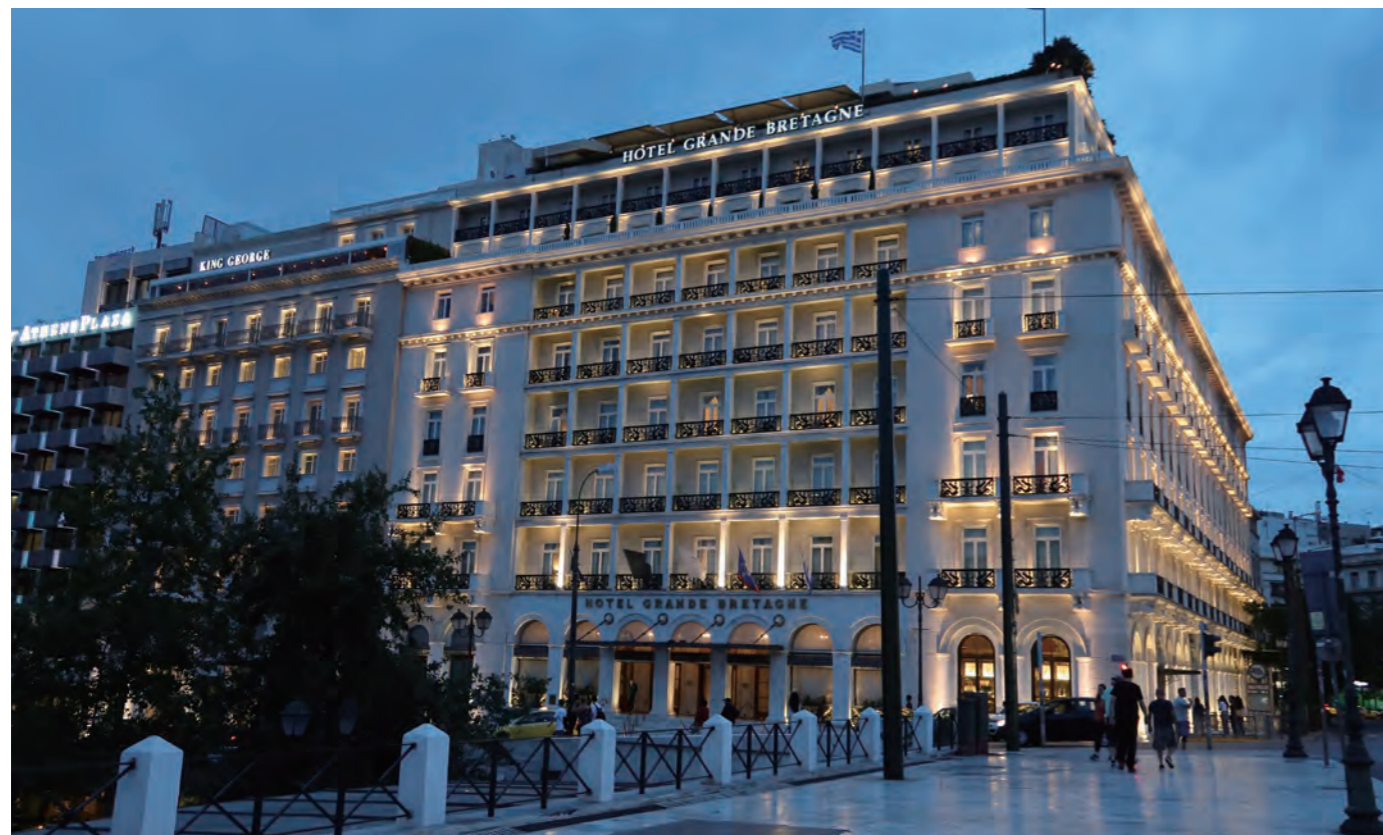
ホテル グランド ブルターニュ「Hotel Grande Bretagne, Athens」は、国会議事堂のあるアテネの心臓部「シンタグマ広場」に面して建つアテネ屈指の伝統と格式を誇る名門ホテルである