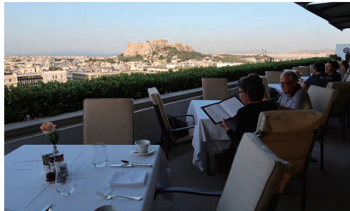
グランド ブルターニュの最大の見どころは「GB Roof Garden Restaurant」であろう。人気のテラス席から間近にパルテノン神殿、そして国会議事堂はもちろん、シンタグマ広場で行われる衛兵の交替式などが望める