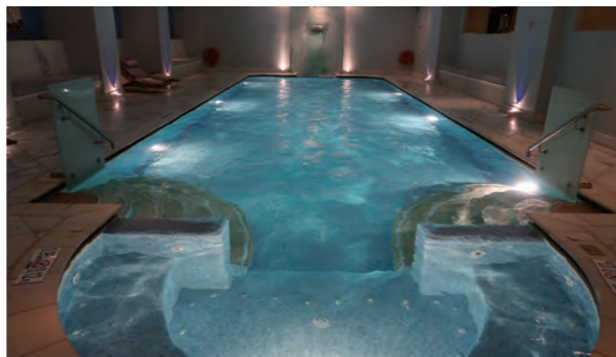
スパ施設「The GB Spa」はゴージャスな屋内スイミングプールを用意している