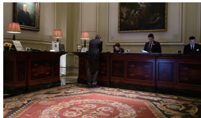
歴史を感じさせる重厚な雰囲気のレストランデスク