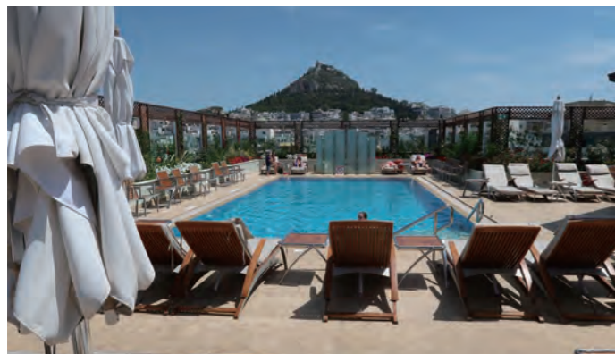
屋上テラス用意されたアウトドアプール。アテネ市街を見渡すことができ、バー&グリル「GB Pool Bar & Grill」を併設している