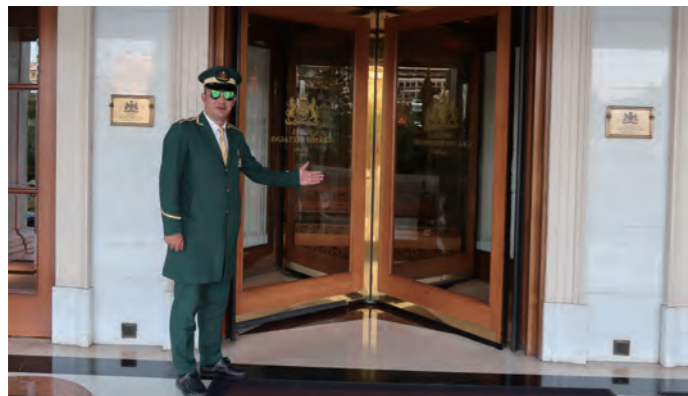
正面エントランスに立つ正装のドアマン