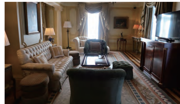
ダイニングに隣接したリビングルーム