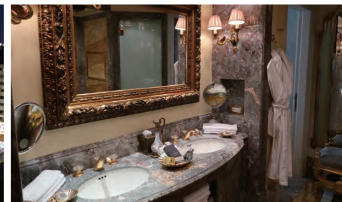
ゴージャスなバスルームのパウダーコーナー