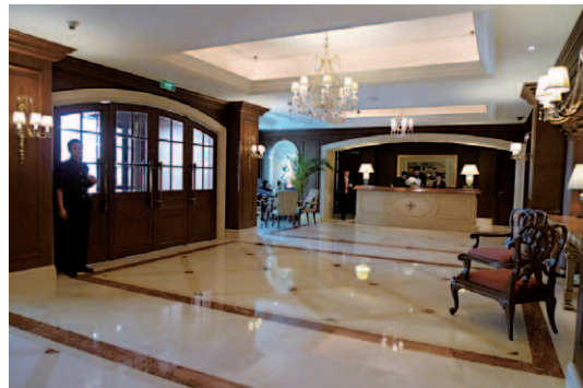
クラシカルなエントランスロビー。正面に見えるコンシェルジュと手前にあるレセプションデスクが向き合っている形だ