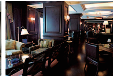
重厚な雰囲気が漂うメインバー「The Ritz-Carlton Bar」