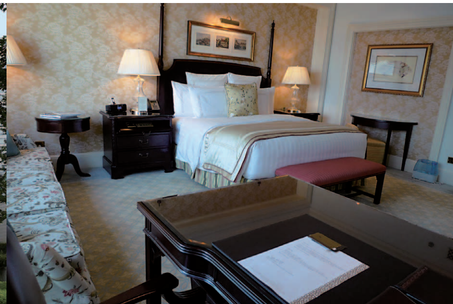
ザ・リッツ・カールトン本来の王道を行く、重厚な古典的質感が漂う客室。この部屋は15階ガーデンビューの「Deluxe Club Room King」で48㎡の広さを誇る