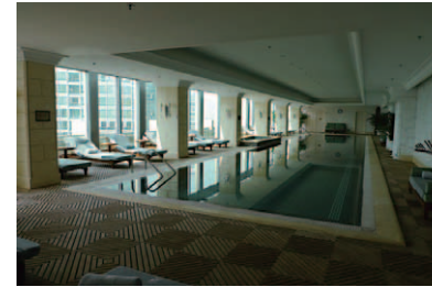
最上階にある古典的な趣のスイミングプール