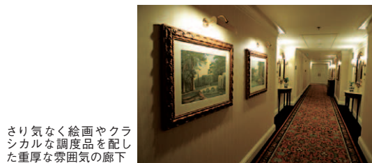
さり気なく絵画やクラシカルな調度品を配した重厚な雰囲気の廊下