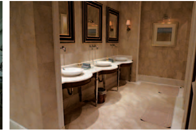
「The Ritz-Carlton Spa」内部にあるシャワーブース前のパウダールーム