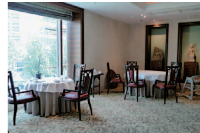
コンテンポラリー感覚の広東料理ダイニング「Yu、玉」。翡翠をイメージしたエレガントな店内だ