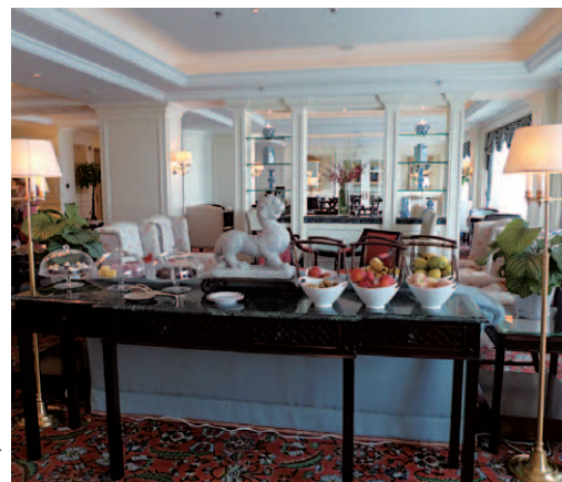
ゴージャスなクラブラウンジ内部。1日5回のフード&ビバレッジのプレゼンテーションが楽しめる