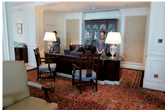
16階にあるクラブラウンジのレセプション。きめ細やかなホスピタリティーでゲストに対応している