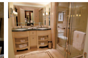
使い勝手の良い充分な広さのバスルーム