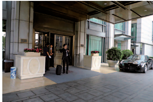
ザ・リッツ・カールトン北京の正面エントランス。規模の割にはやや抑え気味の玄関で好感が持てる