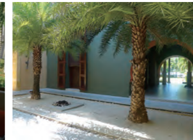
エントランスから迷路のような回廊が続く