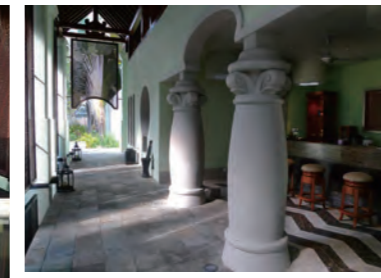
スパ内にあるアラビアンムードが漂うバーカウンター