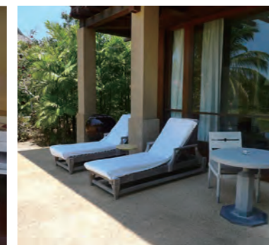
Lower客室には庭園側に張り出したテラスを設けている

鬱蒼としたジャングルの大自然に溶け込んだ「ザ・ダタイ」（本誌 Vol.70、The Daitai 参照）とは対照的に「Four Seasons Resort Langkawi」（以下、FS/L）は、目の前に明るい白砂のビーチとアンダマン海が広がる。タンジュン・ルーの砂浜はまるで「砂漠の砂丘」と表現される様に、きめの細かい砂浜が広大な幅を持って無限に続いている。その浜辺に続く広々とした敷地内には熱帯の植物や花々が咲き誇り、石灰岩の山を背後に望む自然と調和した空間は癒しの効果を最大限に高めている。