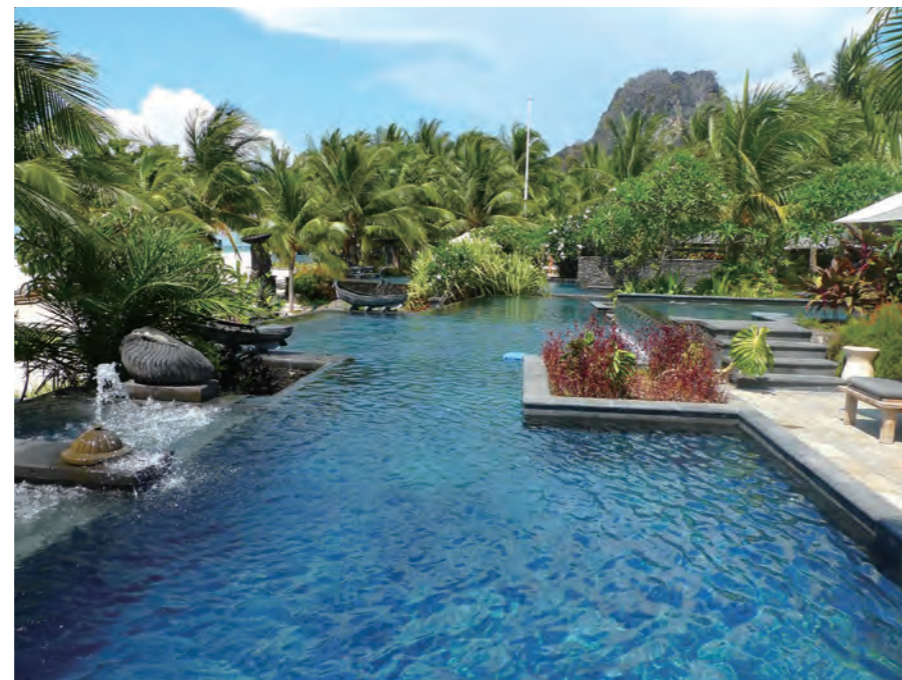
石灰岩の山を背景に家族向けの「Family Pool」が広がる。プールは複雑に入り組んだ形状をして、深さも微妙に異なり、多目的に楽しめる設計だ