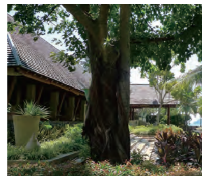
「レモングラス」を意味する地中海料理レストラン「Sarai」