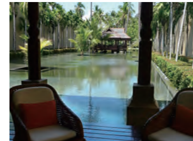
池を望む優雅なチェックインラウンジ