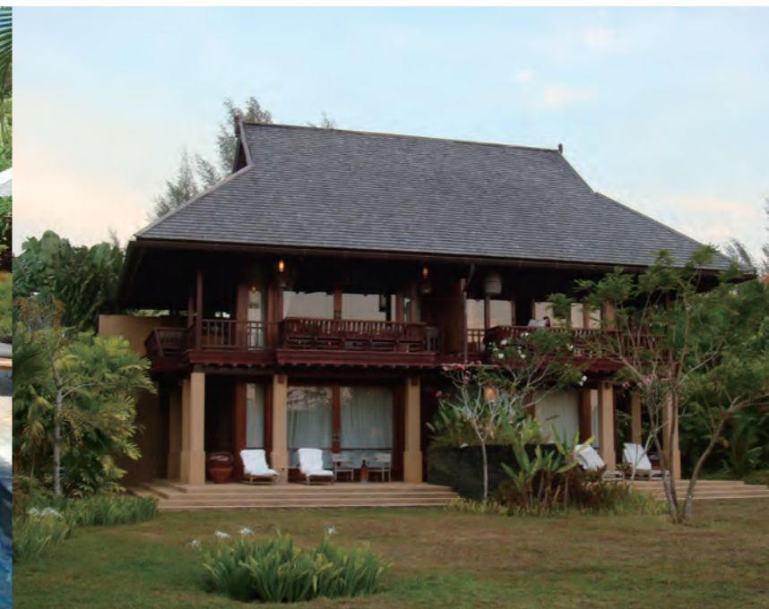
4つの客室を一体化した集合タイプのパヴィリオン「Melaleuca Pavilion」。UpperとLowerのフロアにそれぞれ2部屋ずつ、合計4客室が集合した形のパヴィリオンである