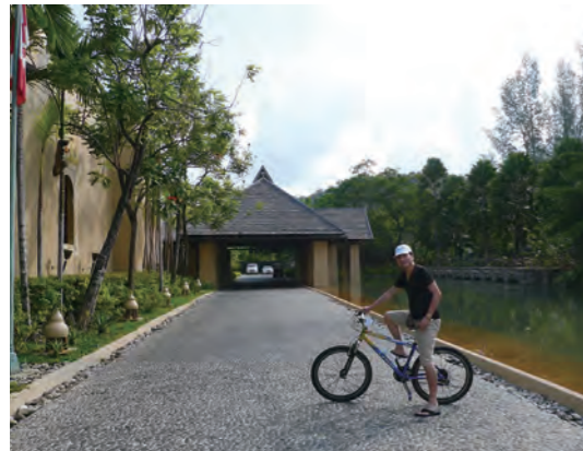
「Four Seasons Resort Langkawi」の車寄せエントランス。広い敷地内の移動は無料のレンタサイクルが便利だ