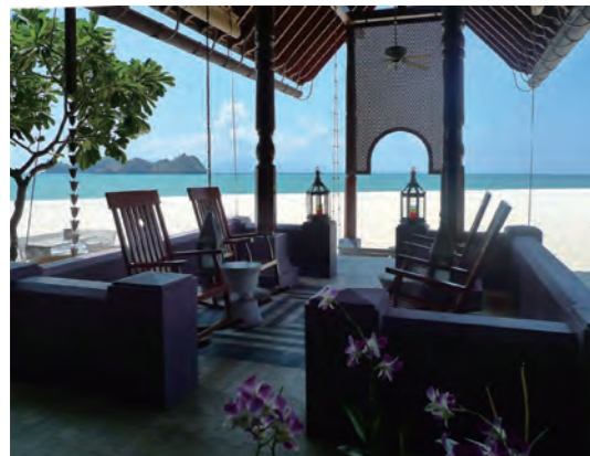
海辺にあるバーラウンジ「Rhu Bar」。ムーア様式の装飾が色濃く反映され、アラブの世界に誘ってくれる