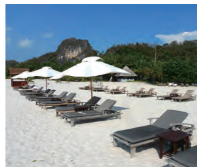
ランカウイで最も美しいと言われるタンジュン・ルーの白亜のビーチが広がっている