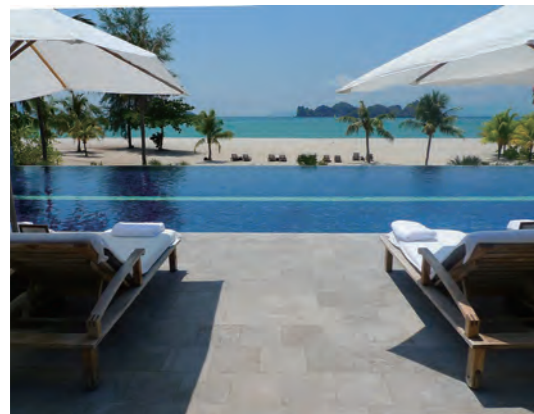
白亜の砂浜の向こうにアンダマン海を望む「Adult Quiet Pool」。専用のカバナを備えたカップル向けの静かなプールだ