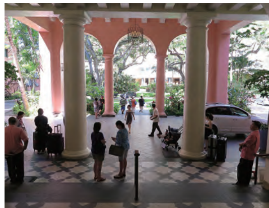
椰子の木など多様な樹木に囲まれた、ロイヤル・ハワイアン の華やかな正面玄関寄寄せ