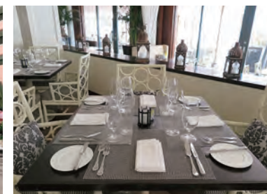
メインダイニング「Azure Restaurant」はハワイの 伝統的調理法で供されるシーフード料理が人気だ