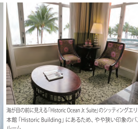
海が目の前に見える「Historic Ocean Jr. Suite」のリビングエリア 本館「Historic Building」にあるため、やや狭い印象のバス ルーム

“太平洋のピンク・パレス”と呼ばれ、数あるハワイの ホテルの中でも独特な存在感を放つホテルが「The Royal Hawaiian」である。その優雅でエレガントな佇まいはハ ワイ随一と言って過言ではないであろう。ロイヤル・ハ ワイアンはハワイ王朝の所有地であったワイキキの「ヘルモア」 の土地に、マトソン商船会社の創立者ウィリアム・マトソン によって建てられ、同社所有の新豪華客船「マロロ号」の 旅客宿泊施設としてスタートした。当時はカリフォルニア から 5 日間の航海を終え、海を見飽きたゲストのためにハ ワイの風土やガーデンを楽しんでもらう配慮で、ホテルの 半分以上の客室から緑の庭園の景色が楽しめるように設 計された。