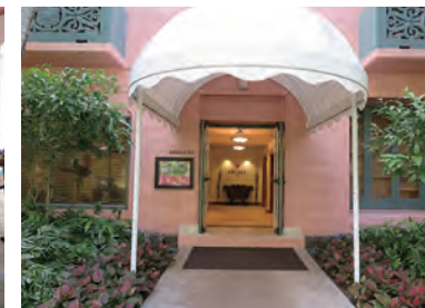
ガーデンコートにある「Abhasa Spa」。庭園内に 点在する専用カバナでのトリートメントが特徴だ