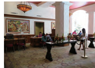
いかにもハワイらしいゆったりとした雰囲気 のレセプションデスク