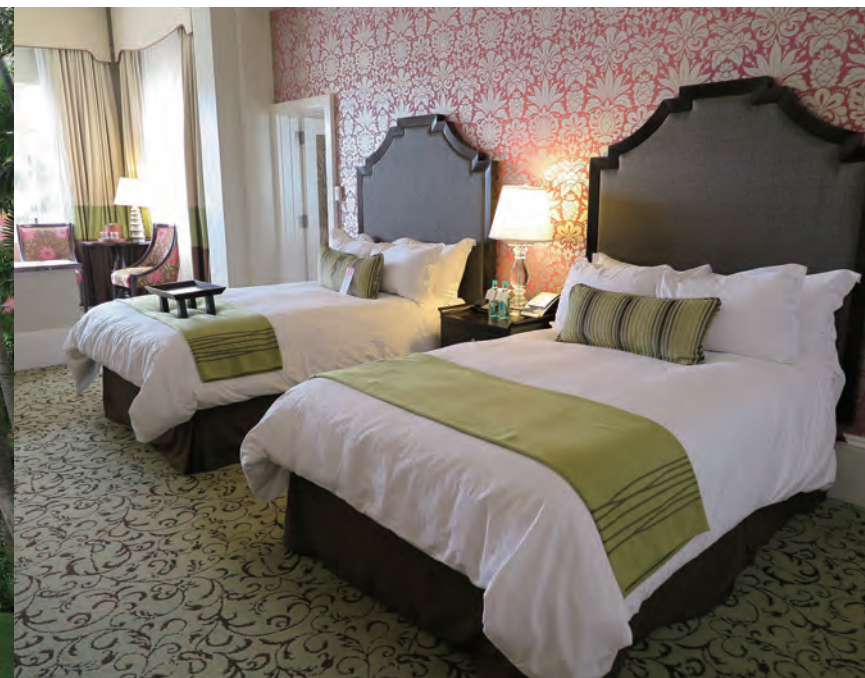
本館側にある優雅な「Historic Ocean Jr. Suite」のベッドルーム。約 50㎡の面積を持ち、段差 で分けられたリビングエリアの付いたオーシャンフロントの Jr. 스위트である