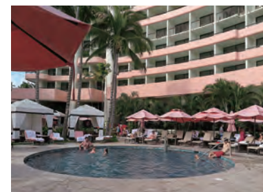
タワー棟「Royal Beach Tower」側に設けられ たスイミングプール