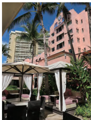
メインダイニング「Azure Restaurant」のガーデンテラス席