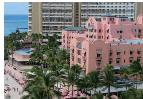
ワイキキ海岸側から俯瞰したホテル全景