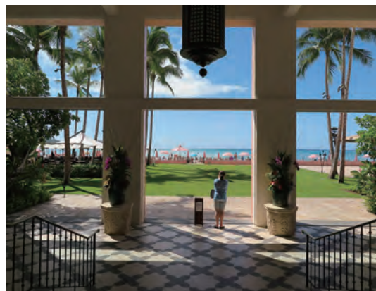
本館オーシャンフロントの絶景ポイント。緑の芝生ガーデンの 向こうにワイキキの海辺が広がる