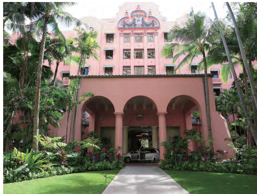
「The Royal Hawaiian」の正面ファサード。「太平洋のピンク・パレス」と呼ばれ、その優雅で エレガントな佇まいはハワイ随一と言って過言ではないであろう