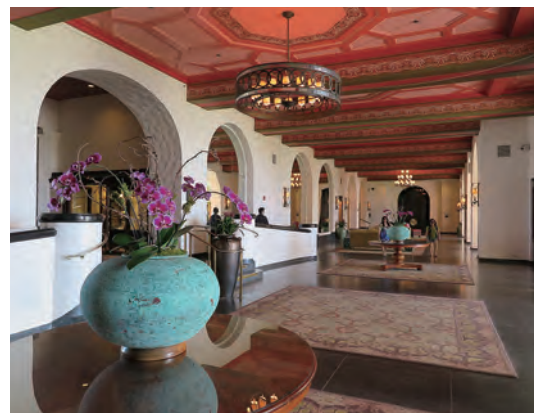
クラシカルなホテル館内は戦前の良き時代にタイムスリップした 雰囲気を感じる