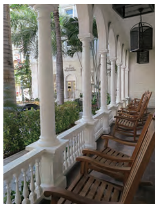
ホテル創業時の面影を残すクラシカルなラウンジ