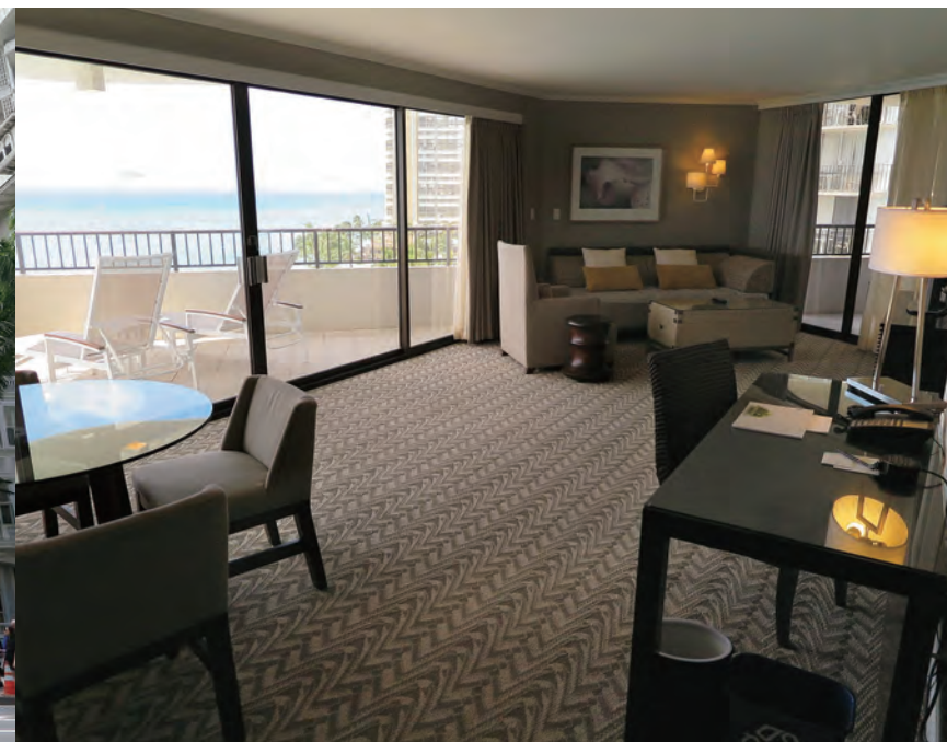
タワー・ウィングにある「Tower Ocean Suite-Diamond Head」のリビングルーム。約73㎡の面積を持つオーシャンフロントのスイートで、コロニアル様式の本館とは趣がだいぶ異なる