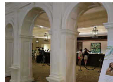
「Tower Wing」と接する本館「Banyan Wing」側にレセプションデスクを設けてある