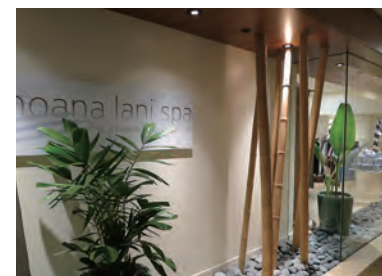
「moana lanii spa」は、ワイキキ唯一のオーシャンフロントのスパとして評価が高い