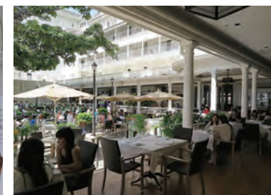
テラスレストラン「the veranda」は、人気のアフタヌーンティーでいつも賑わっている