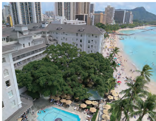
ワイキキの浜辺側から俯瞰した「ワイキキのファーストレディー」の全景