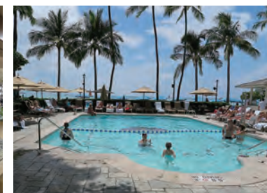
ワイキキの浜辺に面して賑わうスイミングプール