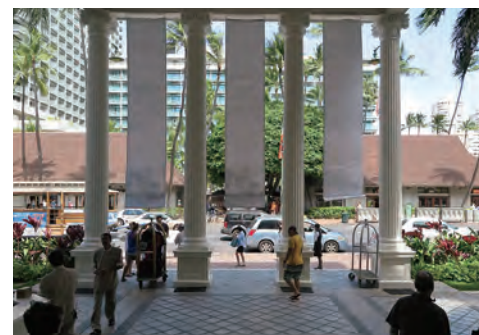
ワイキキを代表するカラカウア通りにあるホテル正面車寄せ