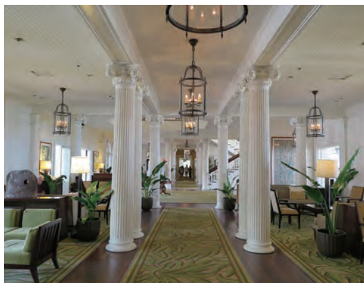
吹き抜けの天井から下がる豪華なシャンデリアと、何本もの白亜の円柱が並ぶロビーに目を奪われる