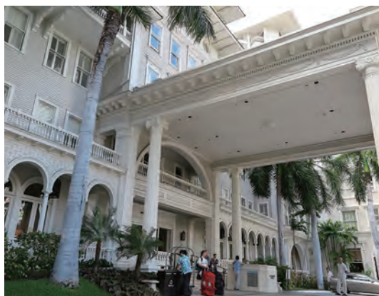
ハワイの数あるホテルのなかで、歴史を感じさせる白亜の建物は「ワイキキ最古のホテル」としての風格が滲む