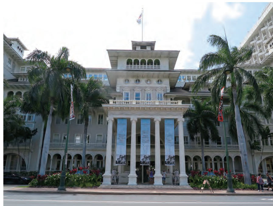
「First Lady of Waikiki」の名に相応しい壮麗なコロニアル様式の建築美とハワイの伝統が調和した「Moana Surfrider, A Westin Resort & Spa」の正面ファサード